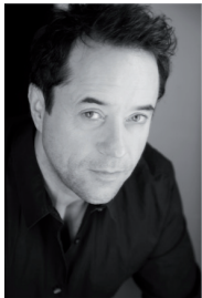
Jan-Josef Liefers Schauspieler, Schirmherr des Projekts

„Ich finde, „Klang und Leben“ großartig und freue mich aus vollem Herzen, dass ich als Schirmherr das Projekt unterstützen darf. Ich habe hautnah erlebt, wie die spontane Freude und unmittelbare Begeisterung über die Musik aus ihrer Jugend die zum Teil schwerstkranken Menschen im Saal wieder zu neuem Leben erweckt hat. Ein unvergessliches Erlebnis. Jede Stadt braucht „Klang und Leben!““