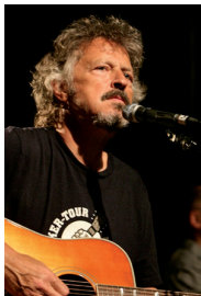
Wolfgang Niedecken Musiker, Maler und Autor

„Klang und Leben ist darauf ausgerichtet, an Demenz erkrankten Menschen eine möglichst hohe Lebensqualität zu schenken. Als Schirmherr unterstütze ich das Projekt und gratuliere zu dieser tollen Idee.“